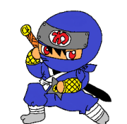
マスコットキャラクター「わせたーマン」